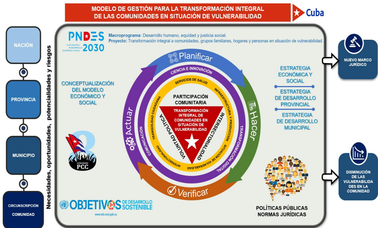
Figura 2. Modelo de gestión para la transformación integral de las comunidades en situación de vulnerabilidad

En el Modelo de gestión para la transformación integral de las comunidades en situación de vulnerabilidad ( Figura 2 ), se resaltan las cuestiones conceptuales y metodológicas que incluye su alcance, componentes, los elementos principales de su funcionamiento, así como los indicadores que se proponen, soportados en un Cuadro de Mando Integral (CMI) para la medición y evaluación del fenómeno, tomando como referencia el Modelo de gestión de gobierno orientado a la innovación. 14,15